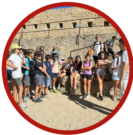
Découverte de l'île et de son histoire