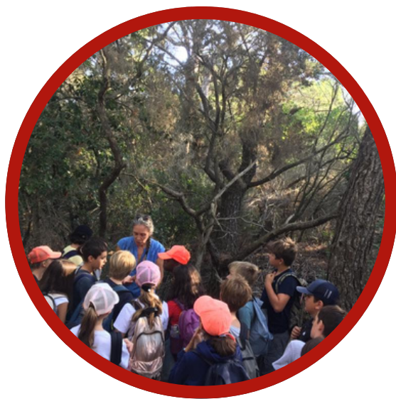
Randonnée pour découvrir la faune et la flore