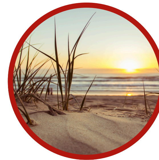
Temps d'échange, de partage et de réflexion