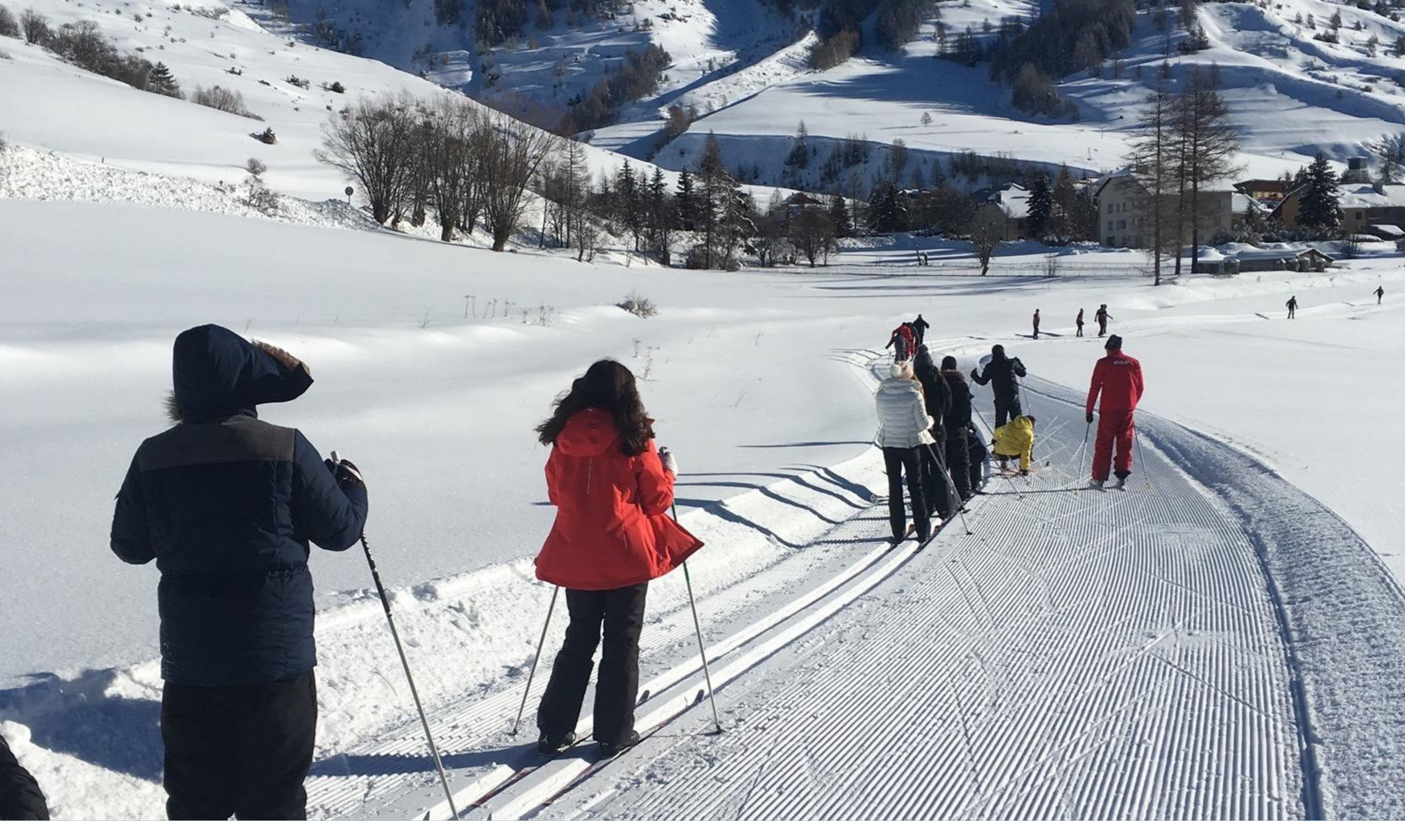
Ski de fond (initiation biathlon)